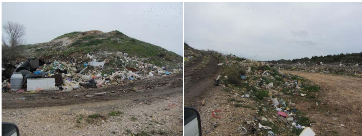
Slika 3. Postojeće stanje na odlagalištu otpada "Leć" na dan prestanka odlaganja otpada na odlagalištu, 29.02.2016.god.

Odlagalište otpada "Leć" ne zadovoljava opće uvjete za odlagališta otpada kako je to određeno propisima, poglavito Pravilnikom o načinima i uvjetima odlaganja otpada, kategorijama i uvjetima rada za odlagališta otpada („Narodne novine“, br. 114/15).