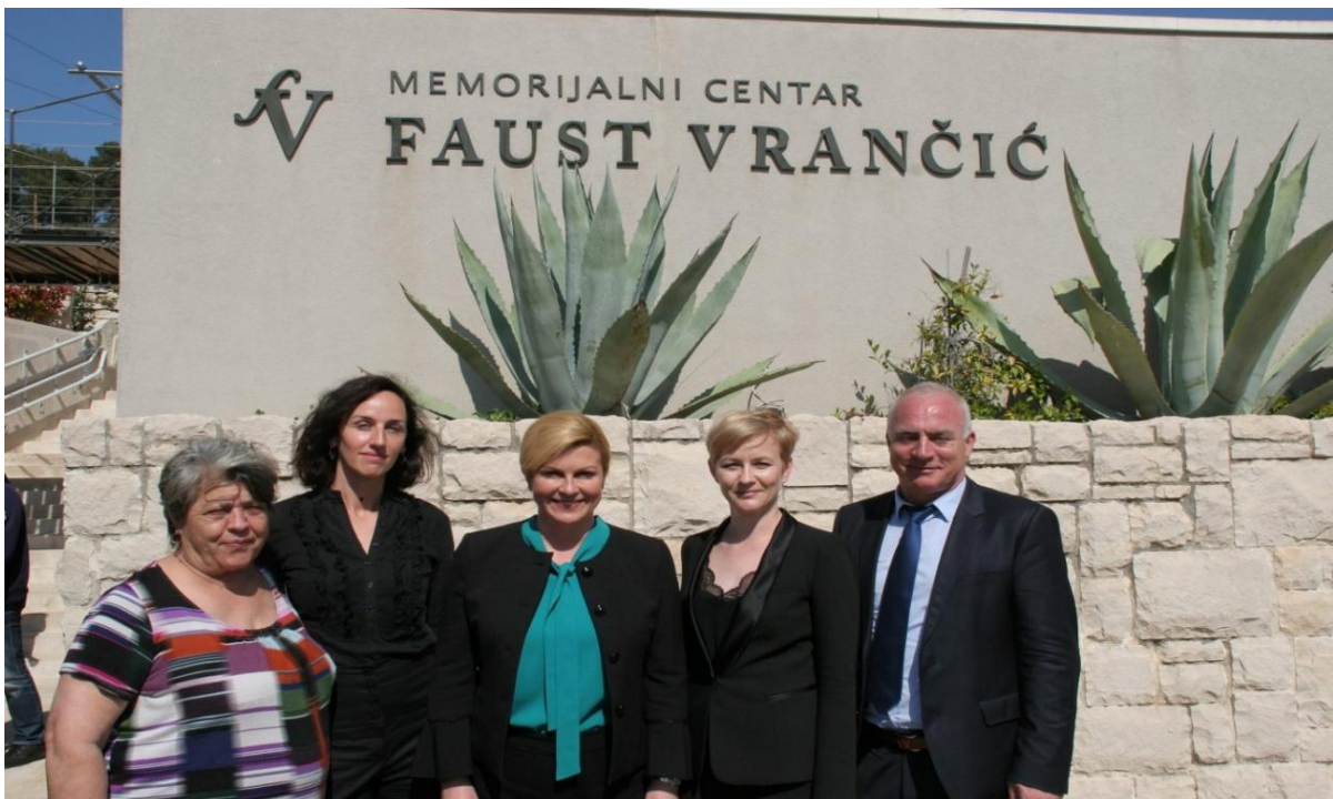
18. travnja 2018. Posjet predsjednice RH Kolinde Grabar Kitarović otoku Prviću i Memorijalnom centru