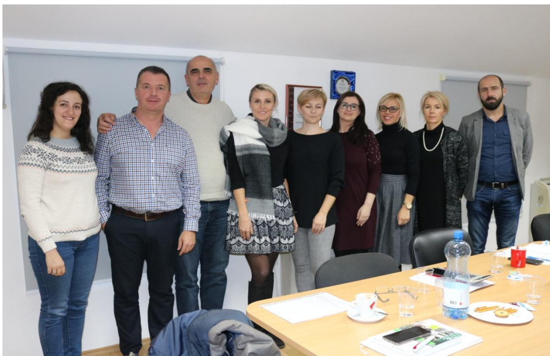
29. studenog 2018. Mostar: radionica izrade partnerskog projekta AMuseTech

Zajednička radionica izrade projektnog prijedloga održana je u Mostaru 29. studenog . Na radionici je sudjelovala ravnateljica Centra. Nositelj projekta je Udruženje LiNK a partneri su Općina Jablanica za korisnika sredstava: muzejski kompleks u Jablanici, Grad Vodice za korisnika sredstava: Memorijalni centar i Narodni muzej Crne Gore u Cetinju. Projekt je prijavljen pod nazivom: Discovering MuseumsthrughModern Technologies , akronim projekta je aMuseTech . Kroz projekt bi se nadogradili i obnovili multimedijalni sadržaji i izložbeni eksponati u Centru, osmislila i izradila signalizacija, osmislio i prezentirao Plan upravljanja sa interpretacijskim planom te održale edukacije na temu upravljanja i razvoja kulturne baštine te promovirali uključeni muzeji pojedinačno kao i kroz partnerstvo na projektu. Rok trajanja projekta je 23 mjeseca. Ukupan budžet projekta iznosi 904,098.95 eura od čega je 85% europskih sredstava a 15% su vlastita sredstva. Budžet za Centar je 228,391.23 eura od čega je zatraženo 194,132.54 eura iz europskih sredstava a Grad osigurava 34,258.69 eura. Rok za prijavu na ovaj poziv je bio do 20. prosinca 2018. godine. Rezultati natječaja se očekuju sredinom 2019. godine.