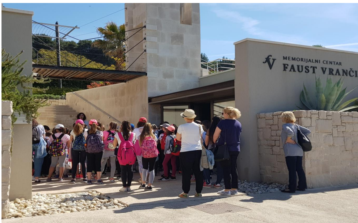
MC Faust Vrančić 2018. godine: Tako to izgleda kod nas