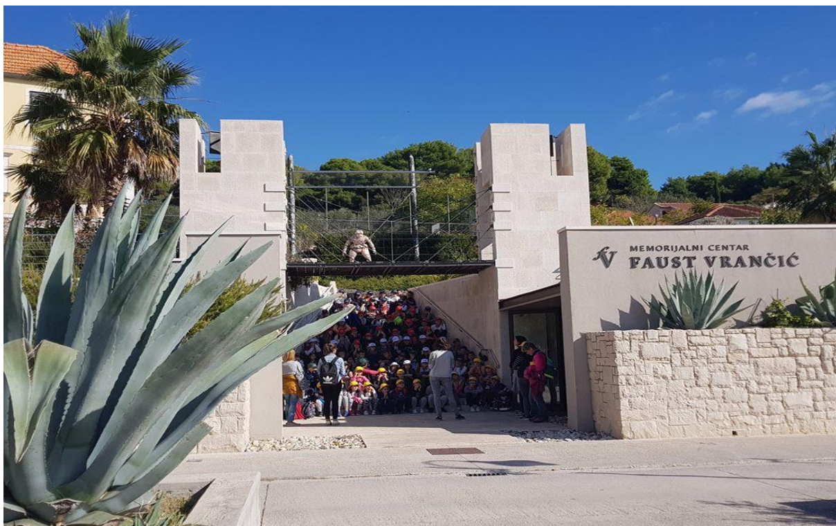
24. listopada 2018. Nama najdraži prizori: posjet trećih razreda OŠ Vodice i područne škole iz Tribunja

Posebna pozornost je posvećena komunikaciji na društvenim mrežama: Facebook i Instagram. Na Facebooku brojimo preko 200 objava, sa 6931 pratiteljem, 6942 lajka, 479 pratitelja nas je fizički i posjetilo te držimo ocjenu 4.9 od 5 na temelju ocjena 80 pratitelja. Na Instagramu imamo 189 objava sa preko 200 objava na storyjima.