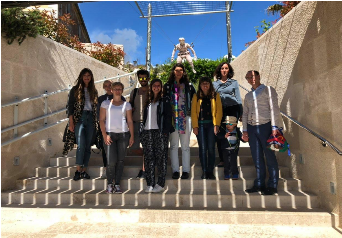
16. svibnja 2018. Posjet mladih polaznika EU programa Eurodyssee