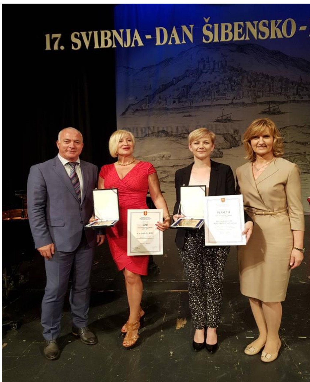
17. svibnja 2018. Dodjela nagrada povodom Dana Šibensko-kninske županije

Ravnateljica je pohađala edukaciju u organizaciji Državne škole za javnu upravu: Menađment u javnoj upravi i Poslovno upravljanje. Edukacija se održala 10. srpnja u Šibeniku.