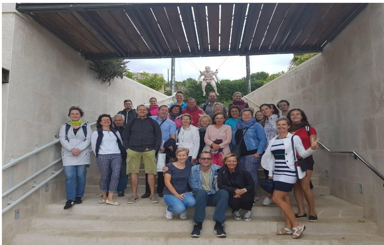
24. rujna 2018. Posjet čeških turističkih agenata u organizaciji HTZ-a