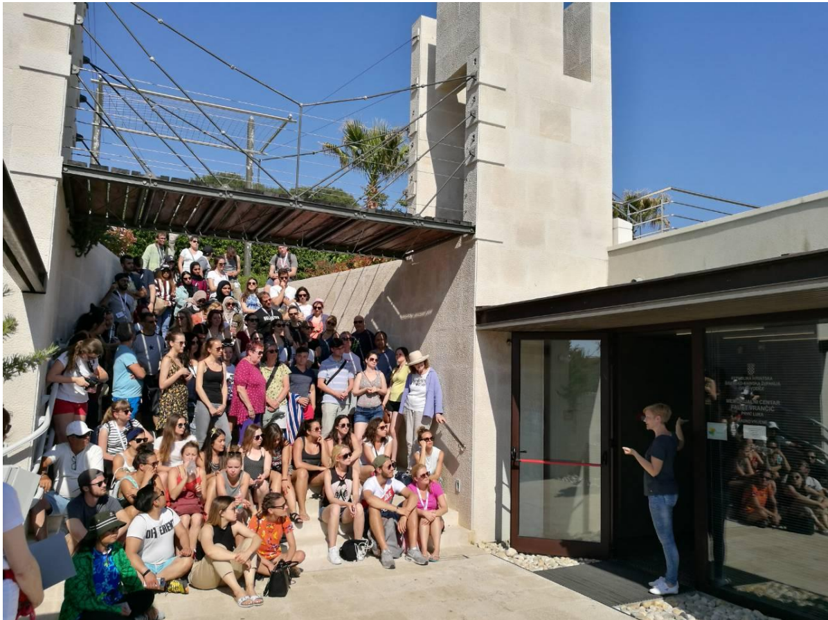
08.svibnja 2018. Posjet studenata ITHAS-a i uvodno predavanje

Osim što se ovaj projekt očitovao u edukativnom smislu za posjetitelje, on je imao i naglašen promotivni karakter za nas, jer se radi o budućim ekspertima u turizmu i najvećim autoritetima u području teorije turizma u svijetu.