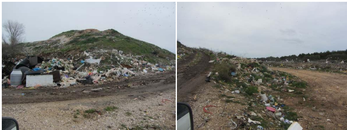
Slika 3. Postojeće stanje na odlagalištu otpada "Leć" na dan prestanka odlaganja otpada na odlagalištu, 29.02.2016.god.

Za predmetno odlagalište izrađena je "Studija o utjecaju na okoliš za sanaciju, privremeno korištenje i zatvaranja odlagališta Leću Gradu Vodice", te proveden postupak procjene utjecaja zahvata na okoliš za koje je ishodueno Rješenje o prihvatljivosti zahvata (Klasa: UP/I 351-03/06-02/188, UR.Br.: 531-08-3-AM-07-7 od 30.04.2007.).