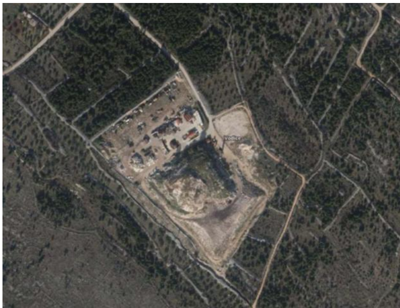
Slika 2. Ortofoto prikaz odlagališta otpada "Leć"

Odlagalište komunalnog otpada Leć nalazi se na širem području Grada Vodica, na njegovom sjeveroistočnom dijelu, na lokaciji k.č. br. 6009/36 K.O. Vodice (koordinate: š: 43°47'5.80"S, d: 15°47'34.57"E), na udaljenosti oko 4km od centra grada Vodica. Na odlagalištu se odlagao komunalni otpad i neopasni proizvodni otpad s područja Grada Vodica (naselja Vodice, Čista Velika, Čista Mala, Grabovci, Gaćezezi, otok Prvić) i Općine Tribunj (naselja Tribunj i Sovalj). Odlagalište se nalazi je ukupne površine 3,06 ha i u vlasništvu je Grada Vodica.